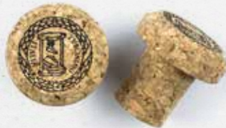
Tappo di chiusura in sughero Cork plugs