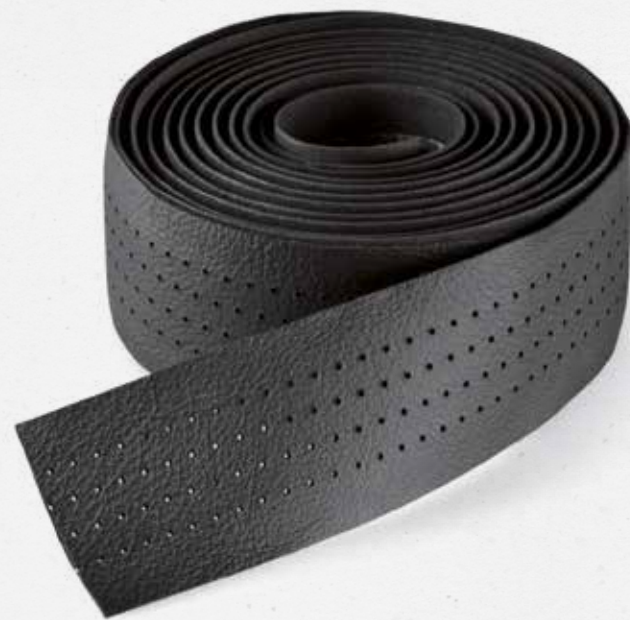
weight 95 g size 35 x 1800 mm colour Black