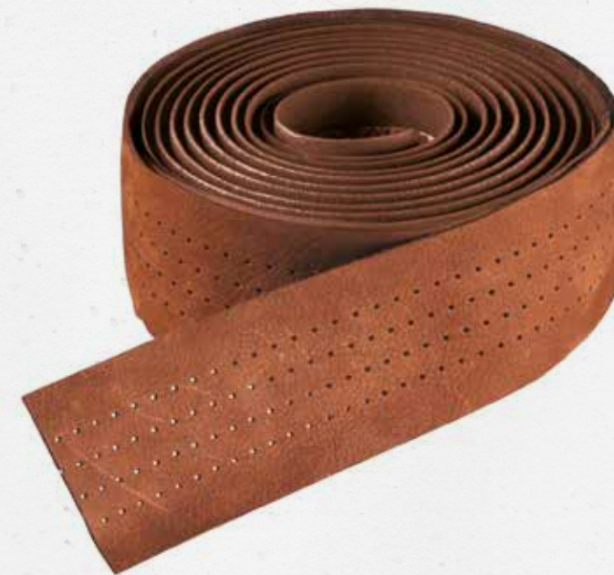
weight 95 g size 35 x 1800 mm colour Honey