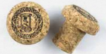
Tappo di chiusura in sughero Cork plugs